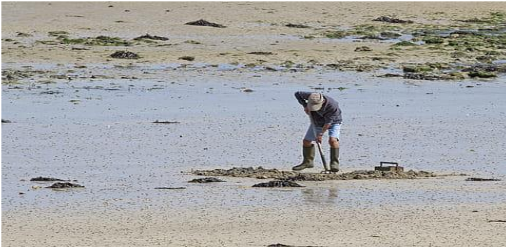
4 сурет - Рекультивация жұмысын жүргізу кезеңі