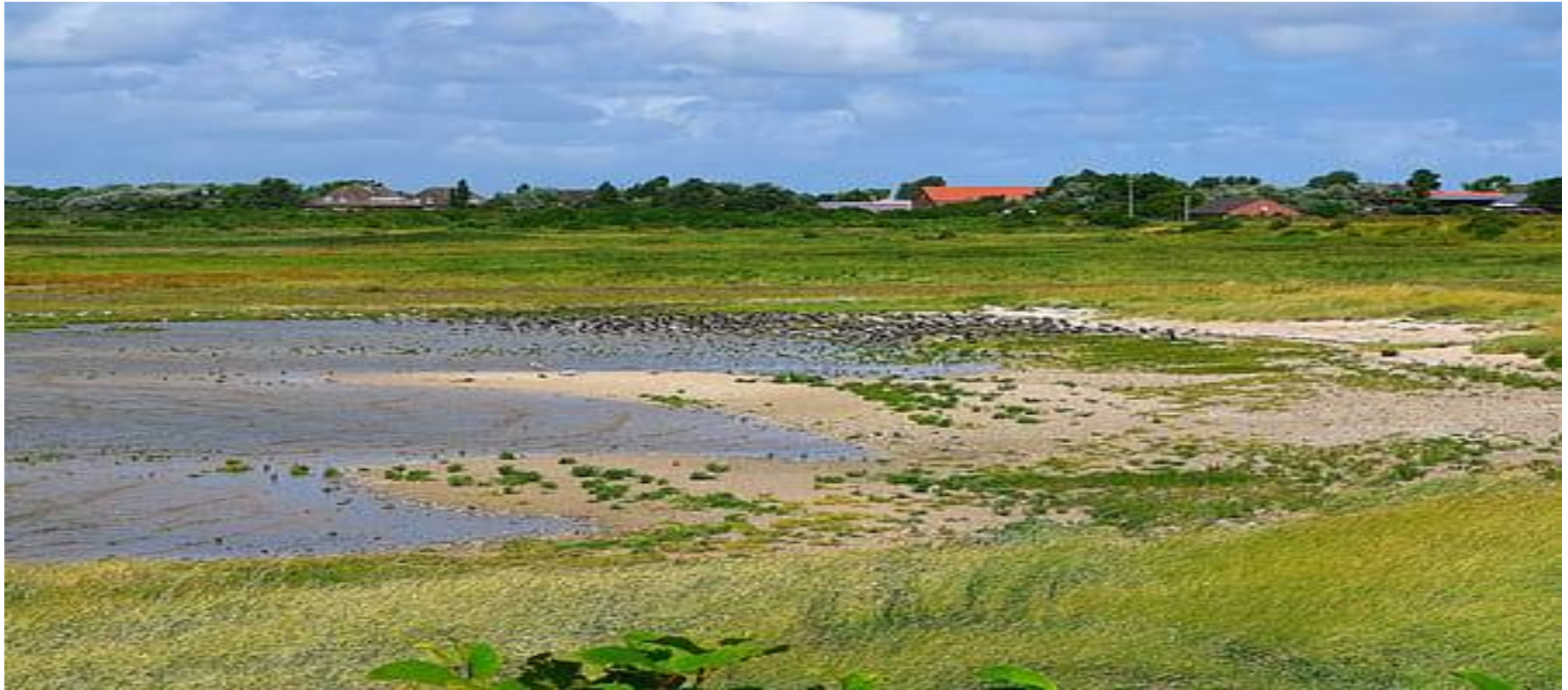
3 сурет - Тозған жердің сыртқы көрінісі