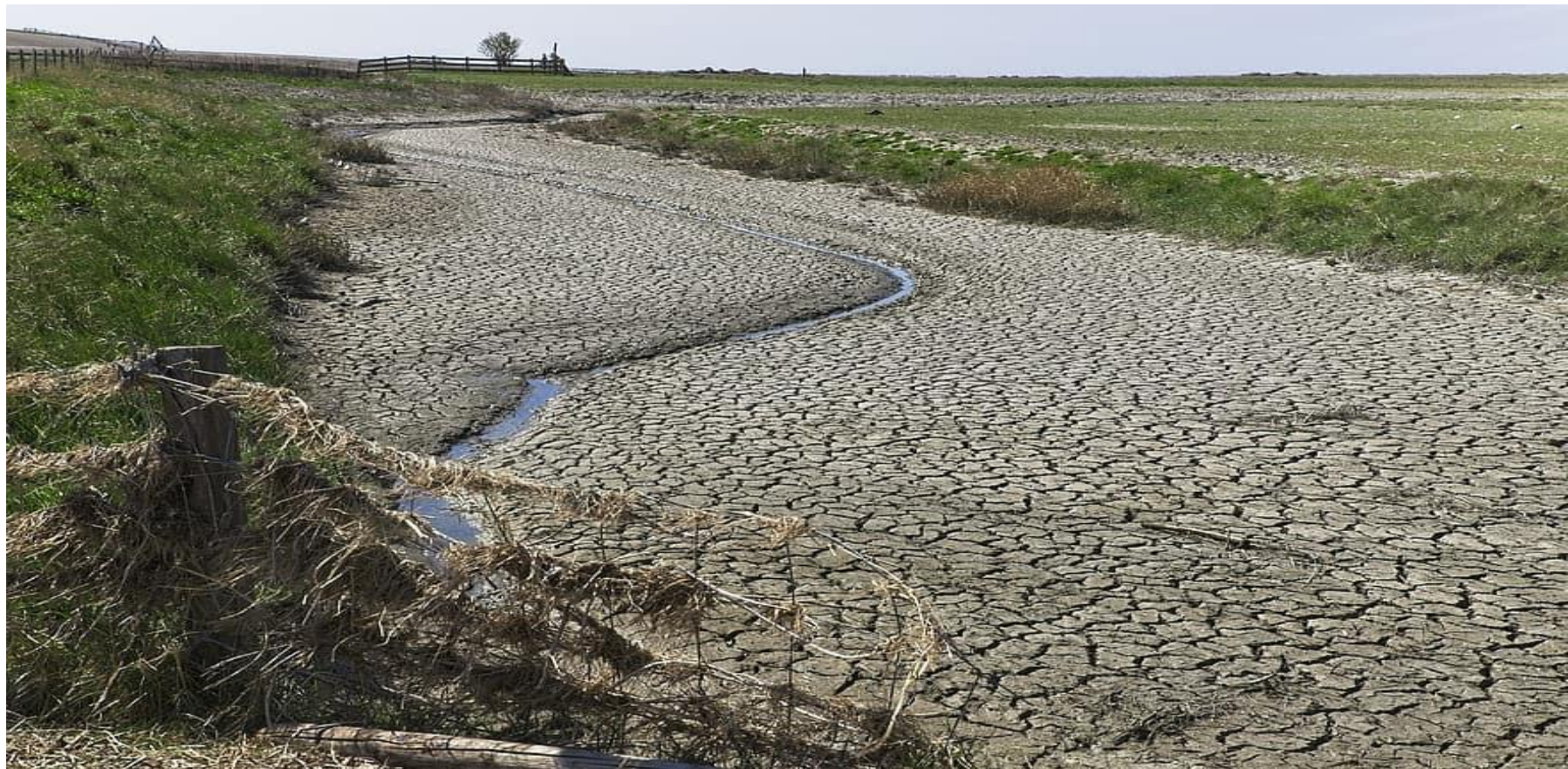
1 сурет - Бүлінген жердің көрінісі