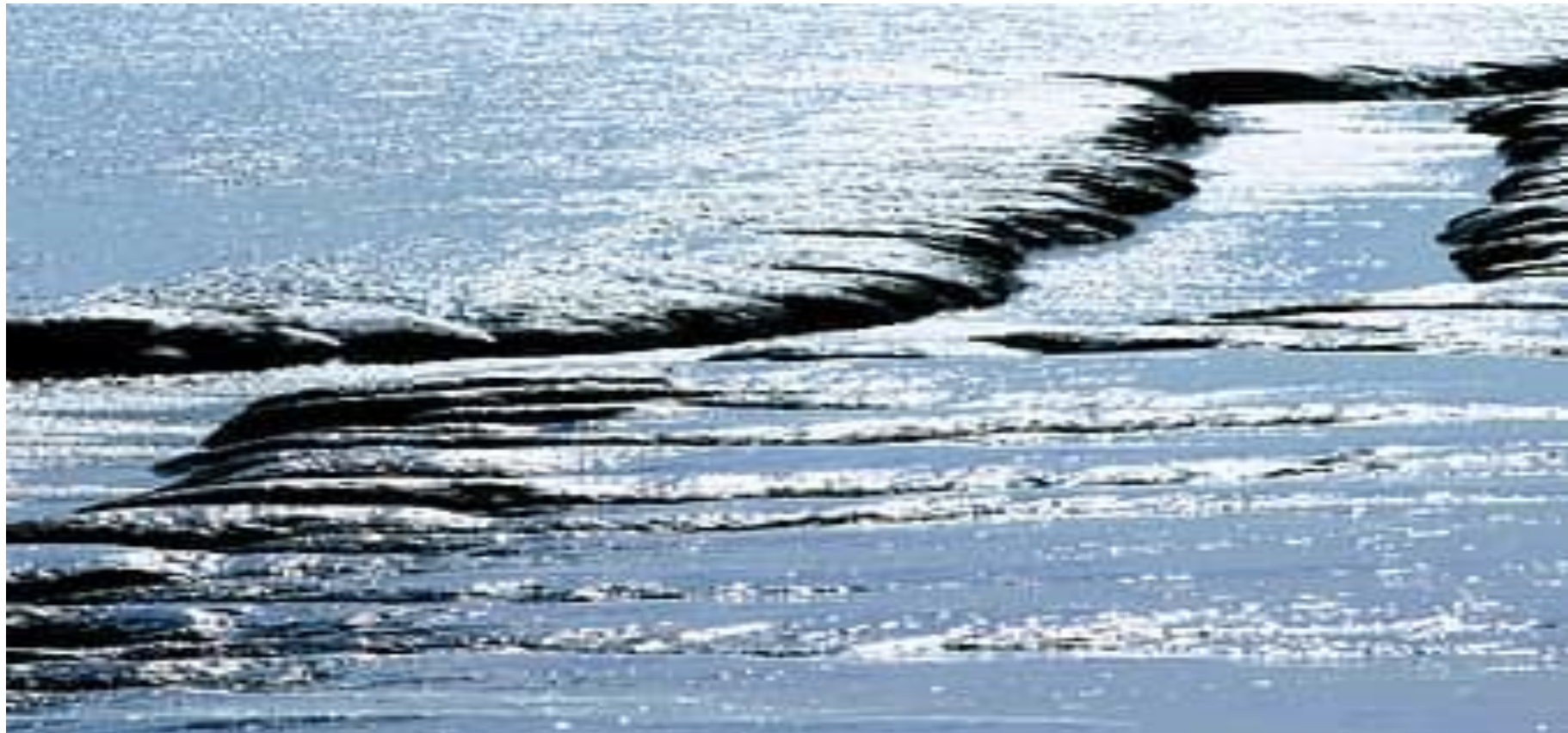
2 сурет - Деградацияға ұшыраған жер бейнесі